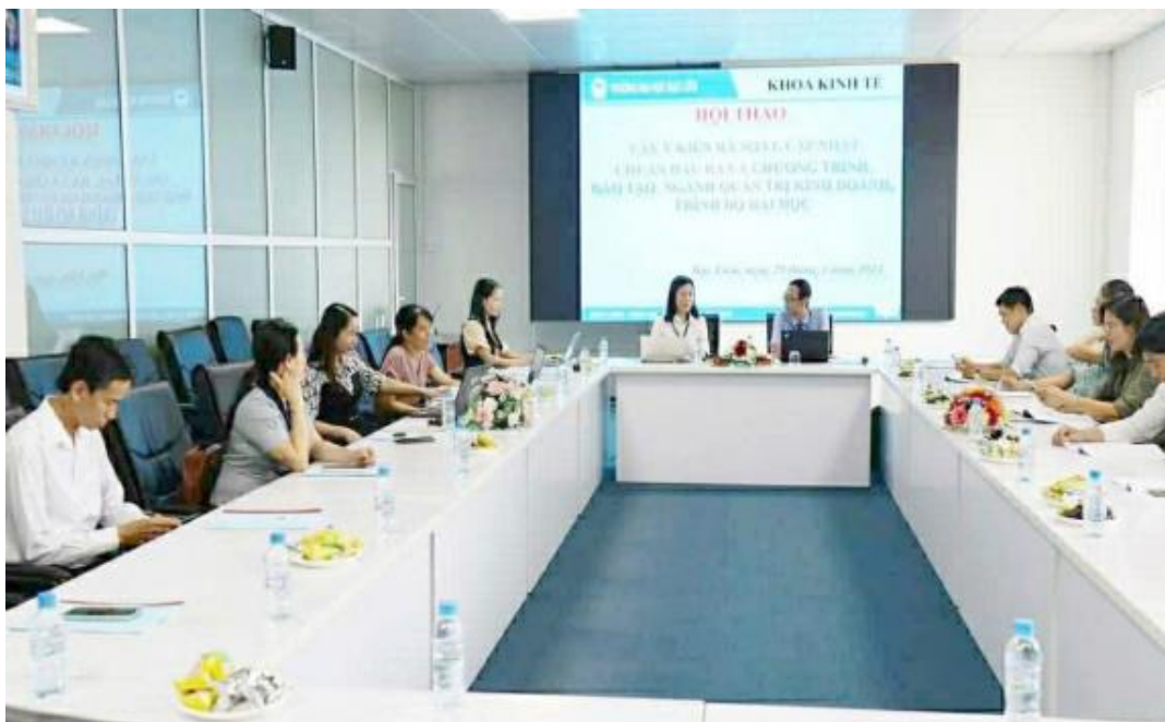
Hình 1.2. Hội thảo lấy ý kiến xây dựng CTĐT

- Thực tế, qua 3 đợt rà soát, cải tiến CTĐT trong chu kỳ đánh giá, nhiều hoạt động thu thập ý kiến đóng góp của GV, SV, cựu SV, chuyên gia, doanh nghiệp... đã được triển khai thông qua khảo sát online, phỏng vấn, hội nghị, hội thảo chuyên đề [H1.01.05.03]