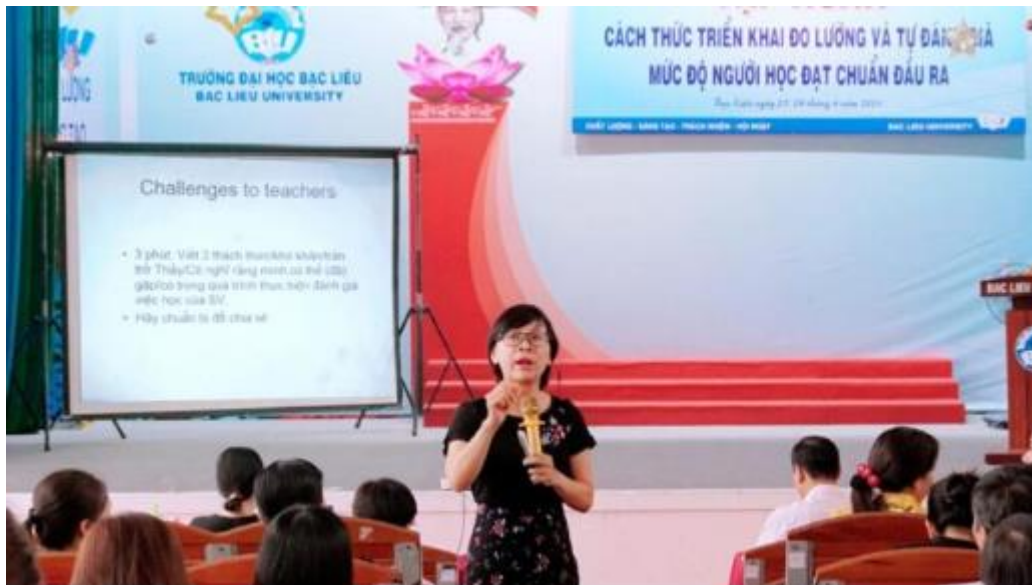
Hình 1.1. Hội nghị tập huấn triển khai đo lường mức độ NH đạt được CDR

Thực tế, trong giai đoạn 2021- 2025, GV đã tham gia 03 đợt xây dựng, rà soát và điều chỉnh CTĐT, cũng như thực hiện điều chỉnh, cập nhật CDR của các HP thuộc CTĐT ngành QTKD [H1.01.04.06]. Trong quá trình này, một số GV trực tiếp tham gia vào Ban/Tổ soạn thảo [H1.01.04.06], một số khác tham gia hoạt động cải tiến CTĐT thông qua việc đóng góp ý kiến tại các cuộc họp, hội thảo theo quy trình rà soát, điều chỉnh CTĐT [H1.01.04.07]. Đặc biệt 100% GV tham gia giảng dạy các HP thuộc CTĐT ngành QTKD đều thực hiện rà soát, cập nhật đề cương chi tiết HP, trong đó có cập nhật, cải tiến CDR của HP [H1.01.04.08].