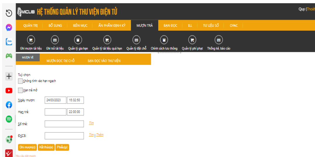
Hình 7.1. Hệ thống quản lý thư viện điện tử

Về tài nguyên thông tin, nguồn học liệu của thư viện đa dạng, bao gồm gần 120.000 bản sách các loại như giáo trình, sách tham khảo, chuyên khảo, luận văn – khóa luận, tạp chí và báo. Danh mục giáo trình và tài liệu tham khảo ngành QTKD được liệt kê đầy đủ, bao gồm tài liệu tiếng Việt và tiếng Anh, học liệu điện tử và website tham khảo cho từng HP, đáp ứng nhu cầu đào tạo của CTĐT [H7.07.03.10]. Bên cạnh học liệu truyền thống, nhà trường phát triển thư viện số và tài nguyên điện tử. Thư viện sử dụng phần mềm thư viện điện tử và thư viện số EMICLIB theo Hợp đồng số 88/HĐ-ĐHBL ngày 09/09/2016 [H7.07.03.11, H7.07.03.12]. Nhà trường xây dựng quy trình biên mục tài liệu số và kế hoạch phát triển thư viện điện tử, đồng thời hướng đến kết nối với các thư viện khác nhằm mở rộng khả năng tiếp cận học liệu. Quy định sử dụng tài nguyên thư viện (Điều 9, Khoản 6) nêu rõ cấm sao chép tài liệu trái phép, thể hiện yêu cầu tuân thủ bản quyền [H7.07.03.02].